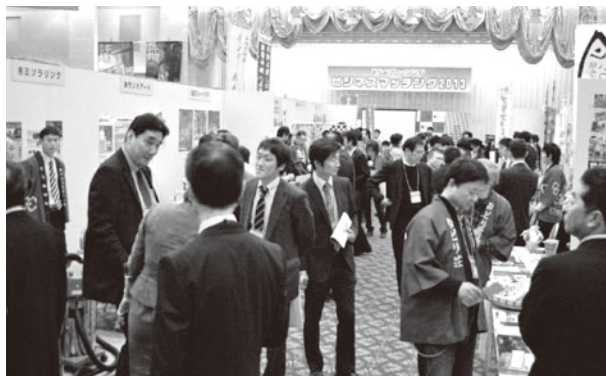
■ビジネスフェア・商談会へのバイヤー招聘実績

信金中金は、信用金庫が主催するビジネスフェア・商談会への大手バイヤー企業等の招聘を通じて、信用金庫によるビジネスマッチングを支援しています。鹿児島相互信用金庫が主催するビジネスマッチングでは、20年度「そうしん食&アグリ・マッチングフェア2008」、21年度「"おすすめ"食&アグリマッチングフェア2010in鹿屋」、22年度「そうしん食&アグリ特別商談会in 薩摩川内」、23年度「かごしま北薩摩まるごと食・観商談会in 出水市」、24年度「そうしんまるごと食・観商談会in 霧島市」および「そうしんブレイク21」ビジネスマッチング2013等において、バイヤー招聘支援を行っています。